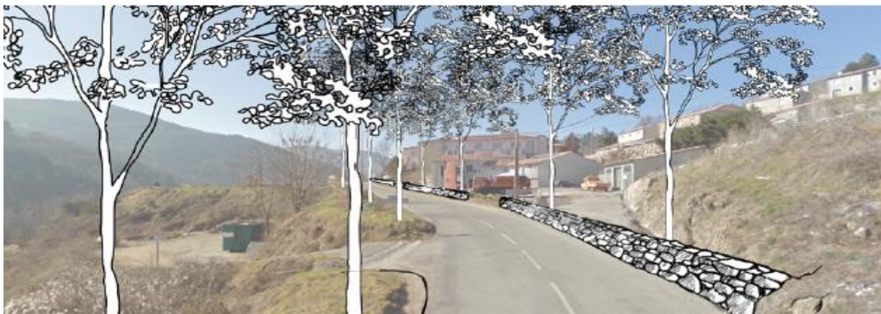
L'entrée du village - scénario désirable

Florent DUMAS appuie sur certaines des fiches contenues dans ce plan guide (intitulé Feuille de route opérationnelle) et notamment sur la requalification de l'entrée du village par la RD152 (axe 1).